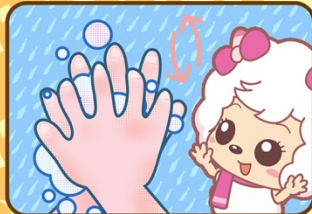
2. Je frotte le dos d'une main avec la paume de l'autre main, et je passe bien les doigts entre les doigts.