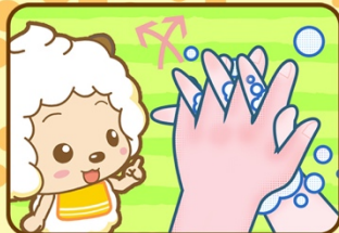
3. Je frotte les paumes l'une contre l'autre, et entre les doigts.