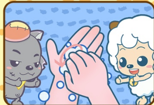
6. Je fais des cercles dans ma paume avec le bout des doigts pour nettoyer sous mes ongles.