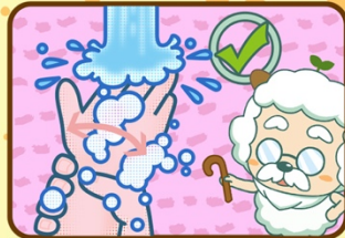
7. Je me frotte un peu les poignet et je me rince les mains sous le robinet.