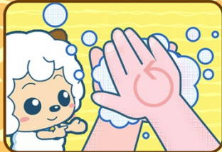
1. Je frotte paume contre paume, je fais tout plein de bulles !