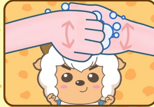
4. J'accroche mes mains l'une à l'autre tout en massant bien mes ongles.